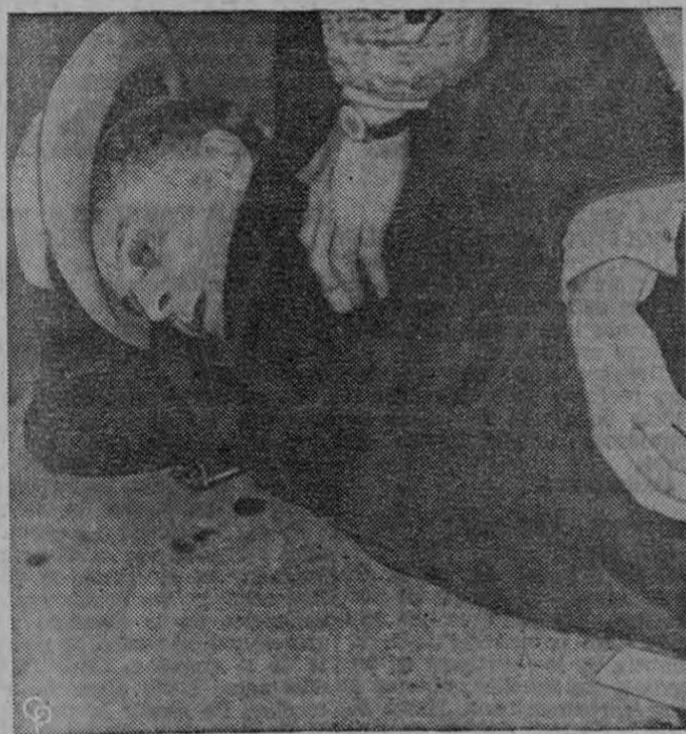
LE SEGARON LA VIDA. —Roger Touhy, de 61 años, aparece en un charco de sangre después que fue abaleado en una zona residencial de Chicago. Un policía retirado que acompañaba a Touhy también resultó con heridas de balas. Touhy fue herido en una pierna y falleció cuando era conducido al hospital. El barón de la cerveza de la era de la prohibición salió de la prisión recientemente después de haber cumplido 25 años tras las rejas por el secuestro de Jake (El Barbero) Factor.