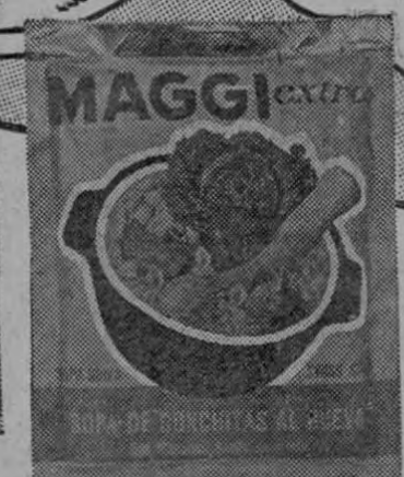
CONCHITAS AL HUEVO