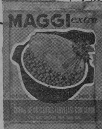
ARVEJAS CON JAMON