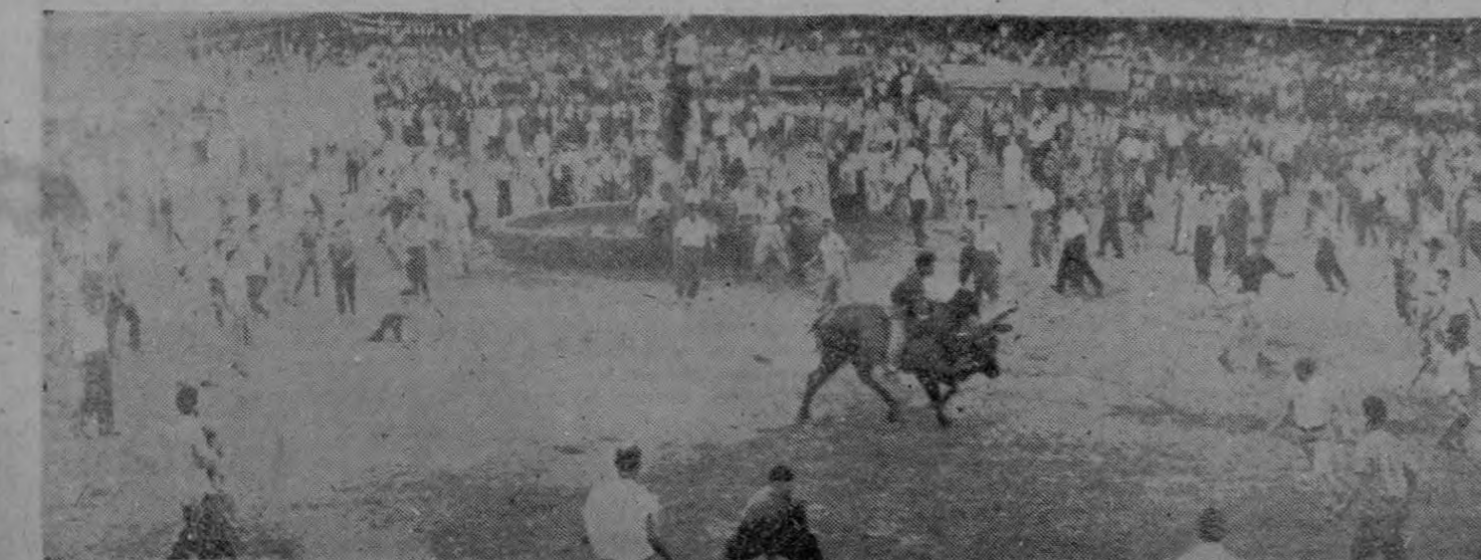
Un par de osados montadores se juegan la integridad de sus huesos en el redondel de la Plaza González Víquez. Puede notarse que los toreros en la primera corrida de ayer fueron bastantes. El saldo final en las dos corridas fue de un muerto y 33 heridos.

El saldo final en las dos corridas fue de un muerto y 33 heridos.