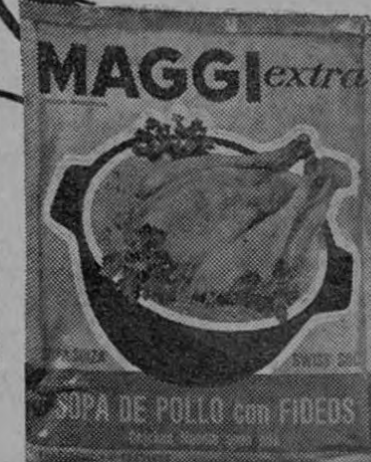
POLLO CON FIDEOS