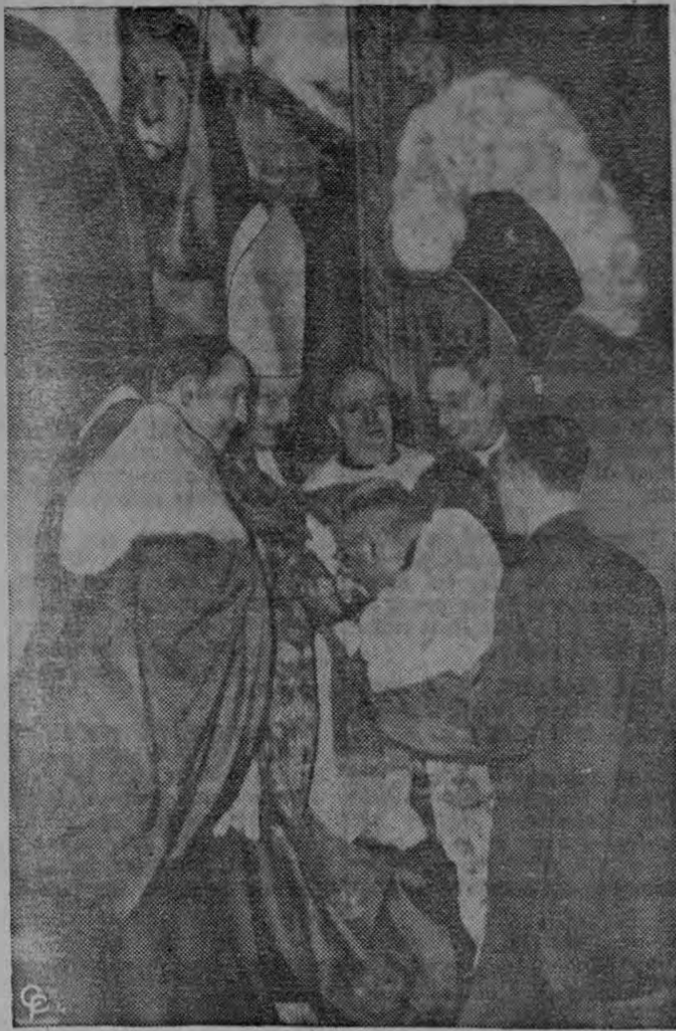
NUEVO CARDENAL. —El Cardenal Albert Gregory Meyer, de Chicago, besa el anillo del Papa Juan XXIII durante un consistorio celebrado en el Vaticano, Roma. El Papa instauró a siete nuevos príncipes de la Iglesia, que formarán parte del Colegio de Cardenales.

NUEVA YORK, 26 — (UPI). El año de 1959, que al comenzar presagió grandes calamidades para los países productores de café, termina abriendo perspectivas más optimistas para los