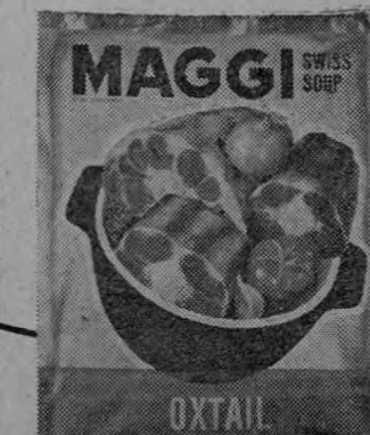
COLA DE BUEY