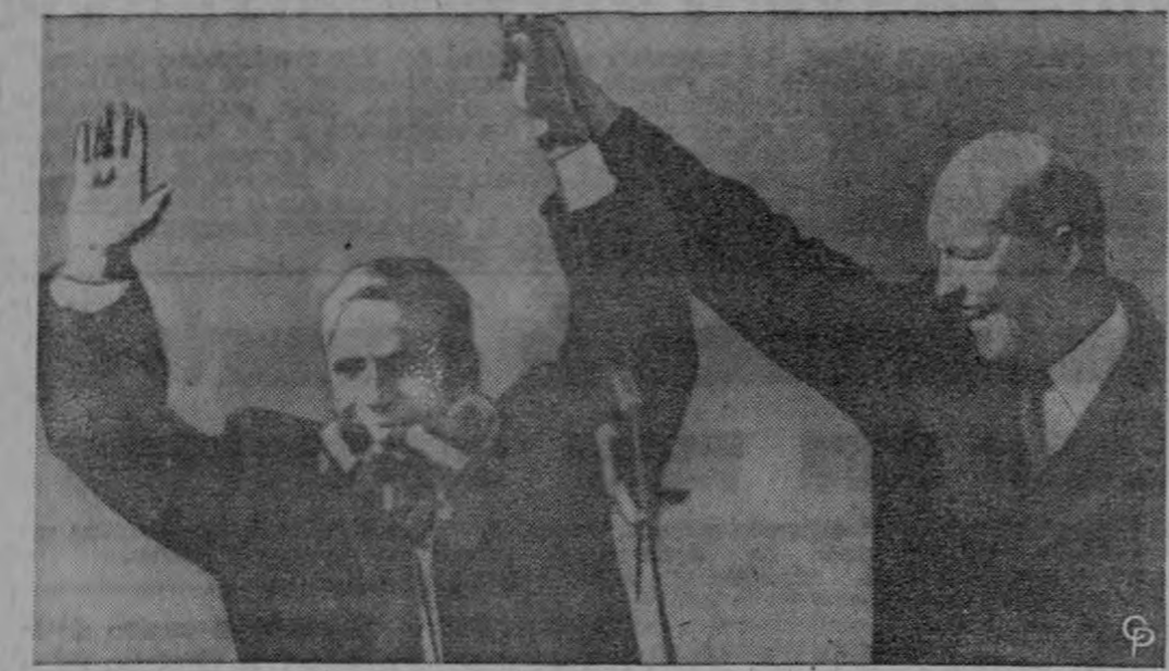
IKE EN TUNEZ.—El Presidente de Túnez, Habib Bourguiba, le estrecha la diestra al Presidente Eisenhower después que el Jefe Ejecutivo norteamericano pronunció un discurso a su llegada a Túnez. Eisenhower prometió levantar los medios de vida de esa empobrecida nación. Fue desde Túnez, hace 16 años, que el General Eisenhower dirigió la invasión de Sicilia, en la Segunda Guerra Mundial.