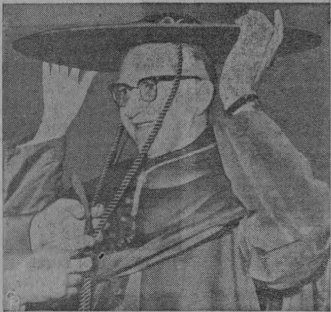
RECIBE EL BIRRETE ROJO DE CARDENAL.—El Cardenal Aloisius Muench, de 70 años, Arzobispo de Fargo, N. D., y que fuera antes de su elevación Nuncio Apostólico en Alemania, se coloca su "galero" (birrete religioso) por primera vez después de las ceremonias en el Vaticano, Roma, Italia. Muench es uno de los dos Cardenales americanos nombrados por el Papa Juan XXIII. El otro es el Cardenal Albert Gregory Meyer, de Chicago.

En efecto, si Rusia entrara en un nuevo período de liberalismo igual al que siguió el XX Congreso del Partido, la Historia, según todas probabilidades, se eliminaría de la circulación. Si, al contrario, la URSS entrara en una nueva era de poder dictatorial, los sucesos, muy pronto, eclipsarían esta obra.